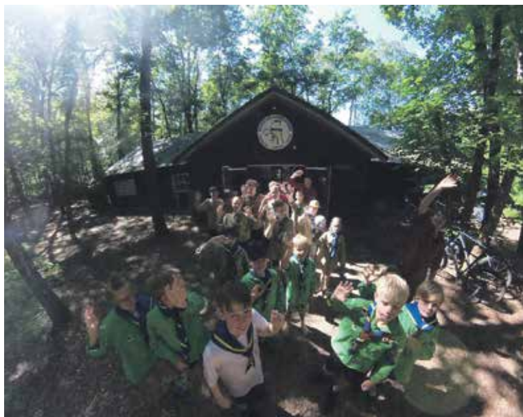
De welpen en scouts na een middag met allerlei waterspelen.

Gorssel- Scouting IJsselgroep in Gorssel staat voor vriendschap, outdoor en traditie. Al ruim 80 jaar hebben vele generaties hier uitdagende activiteiten beleefd.