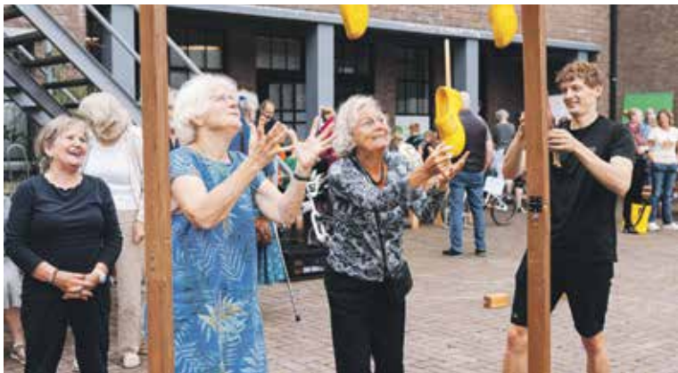
Zomertoer 2025 bij Detmerkazerne in Eefde.

Begin juli lanceren we een speciale webpagina op onze site ( www.welzijnlochem.nl ) waar meer informatie en de programma's per kern te vinden zijn. Organisaties, verenigingen of actieve inwoners zijn van harte welkom om aan te sluiten bij de Zomertoer. Zij kunnen contact opnemen via: zomertoer@welzijnlochem.nl